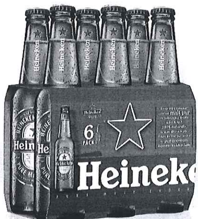
6 pack Heineken sticla 0.33l