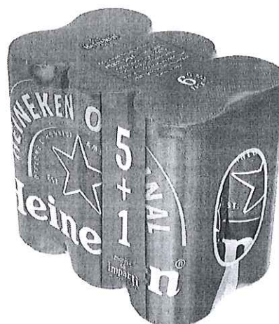
6 pack Heineken doza 0.33l