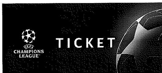
Experienta VIP la Finala UEFA Champions League