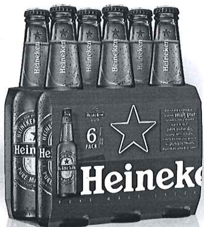
6 pack Heineken sticla 0.33l