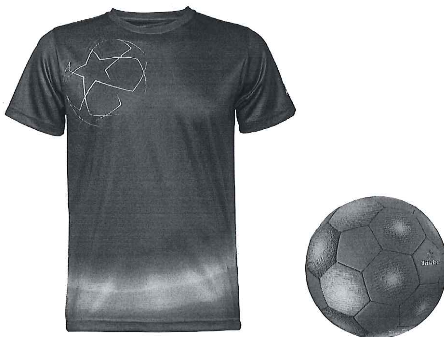
Kit suporter: minge fotbal + tricou

*Imaginile premiilor sunt cu titlu informativ