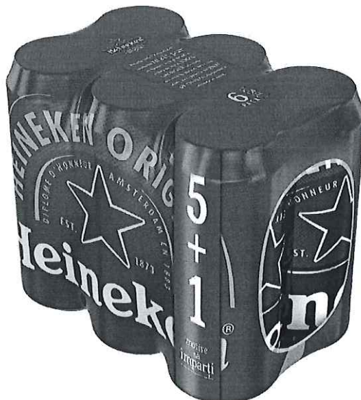
6 pack Heineken doza 0.5l