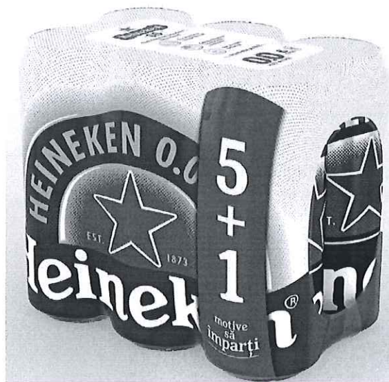
6 pack Heineken doza 0.0% 0.5l