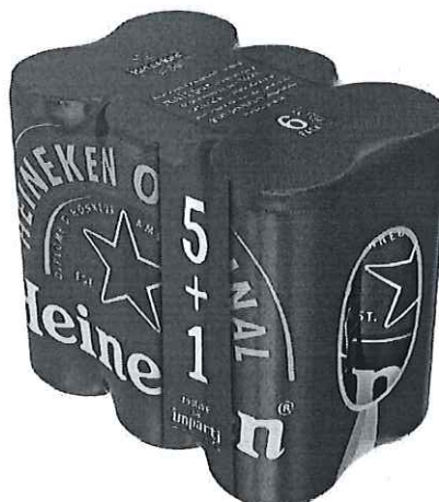
6 pack Heineken doza 0.33l