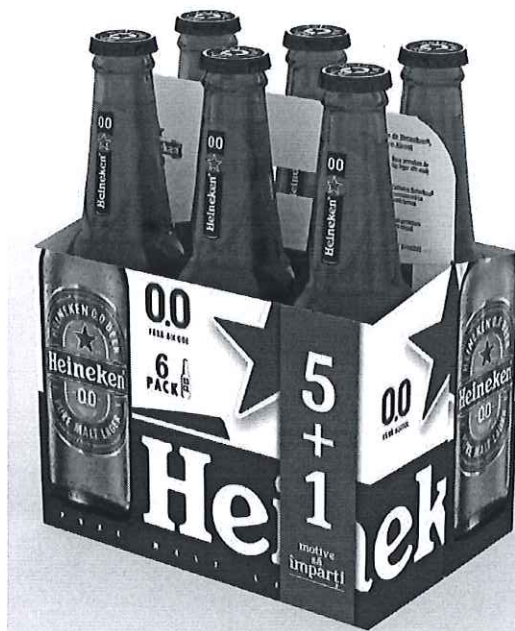
6 pack Heineken sticla 0.0% 0.33l