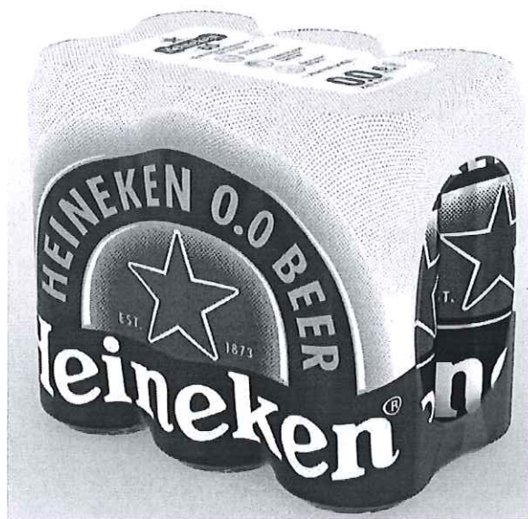
6 pack Heineken doza 0.0% 0.5l