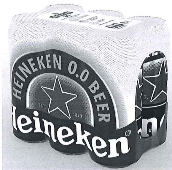
6 pack Heineken doza 0.0% 0.5l