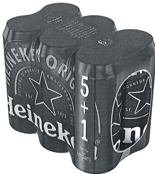
6 pack Heineken doza 0.5l