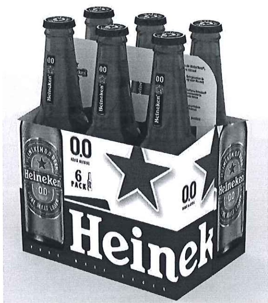
6 pack Heineken sticla 0.0% 0.33l