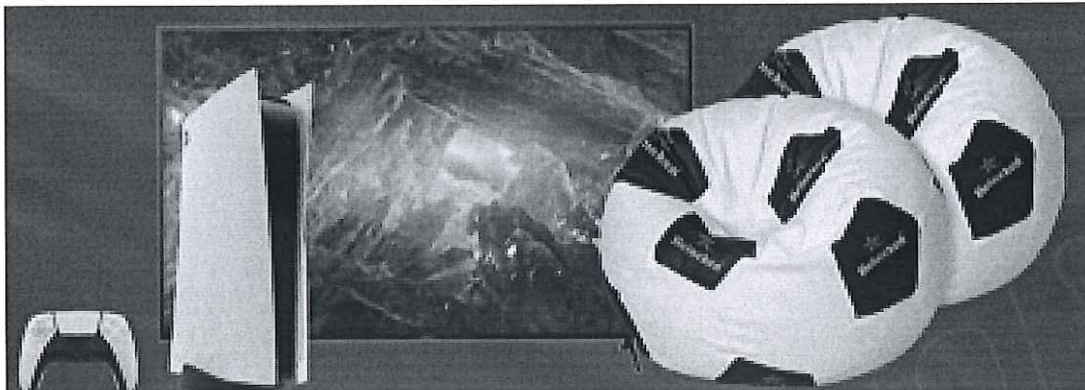
Kit Seara meciului: TV Sony Bravia, Consola PS5, Pufi