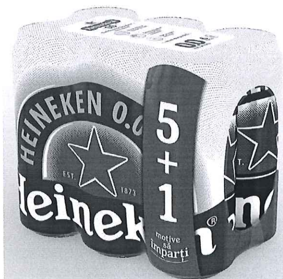
6 pack Heineken doza 0.0% 0.5l