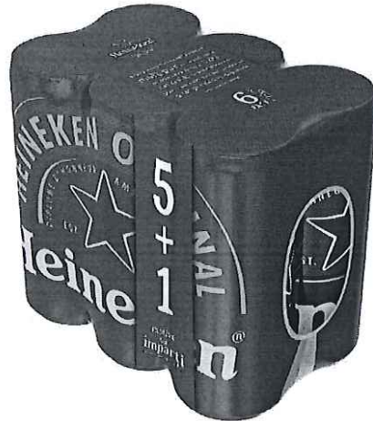
6 pack Heineken doza 0.33l