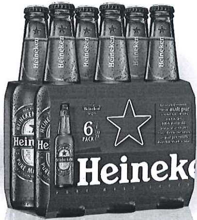
6 pack Heineken sticla 0.33l