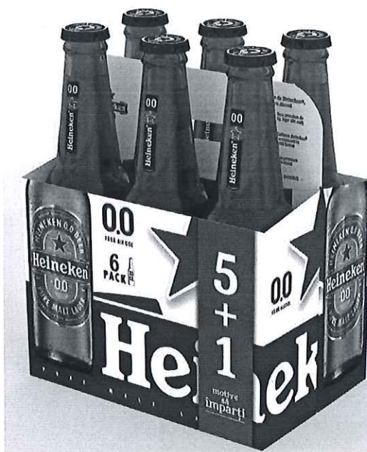
6 pack Heineken sticla 0.0% 0.33l