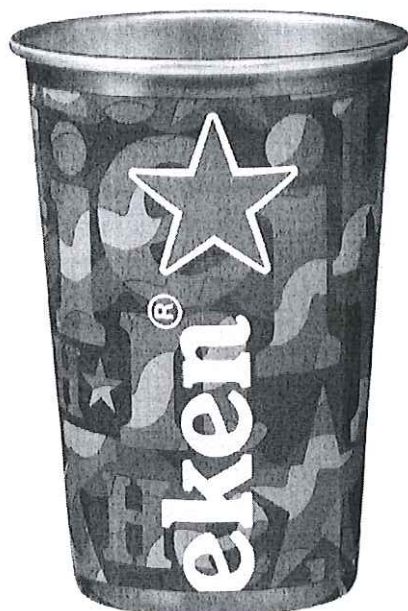
Pahare de sarbatoare inscriptionate Heineken®

*Imaginile premiilor sunt cu titlu informativ