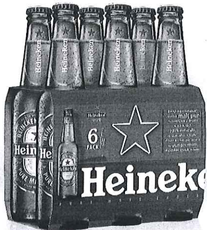
6 pack Heineken sticla 0.33l