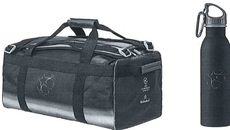
Kit suporter: geanta sport + sticla de apa