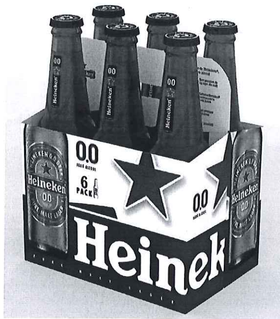
6 pack Heineken sticla 0.0% 0.33l