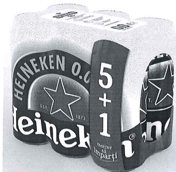
6 pack Heineken doza 0.0% 0.5l