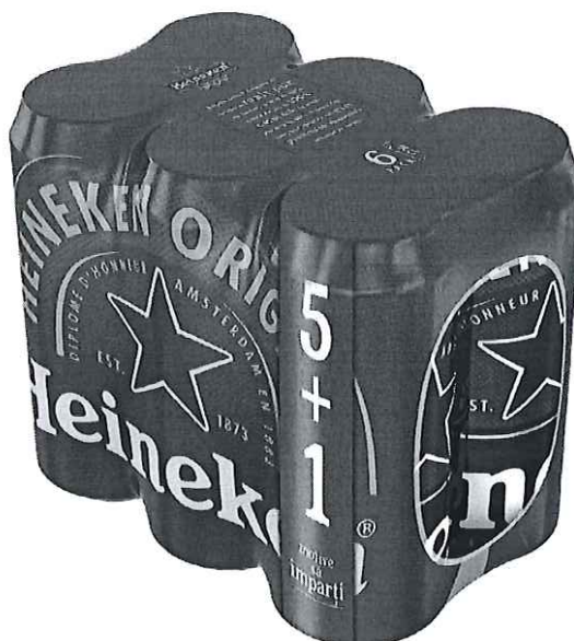
6 pack Heineken doza 0.5l