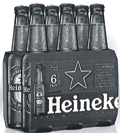
6 pack Heineken sticla 0.33l