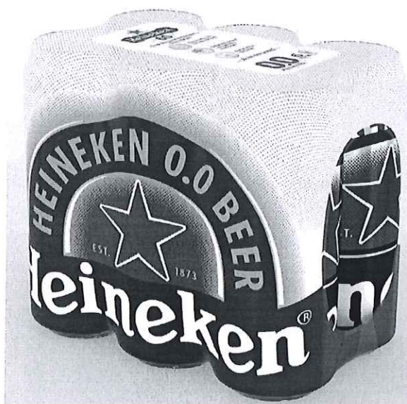
6 pack Heineken doza 0.0% 0.5l