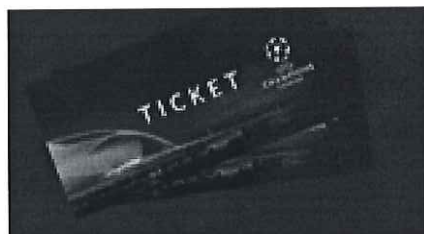
Bilete duble la Semifinala UEFA Champions League

*Imaginile premiilor sunt cu titlu informativ