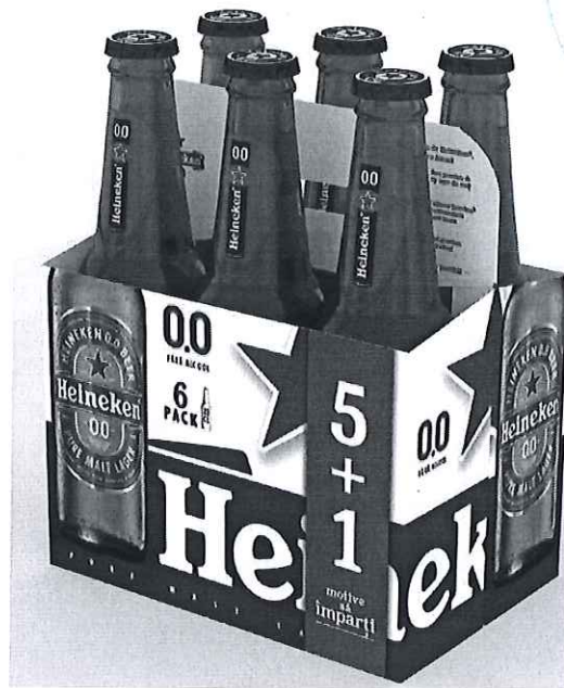
6 pack Heineken sticla 0.0% 0.33l