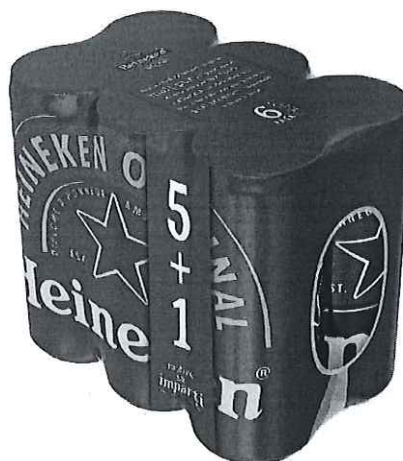
6 pack Heineken doza 0.33l