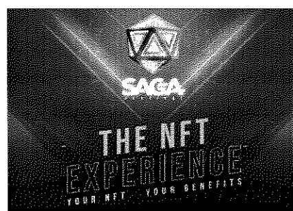
Experienta dubla SAGA Festival 2024

*Imaginile premiilor sunt cu titlu informativ