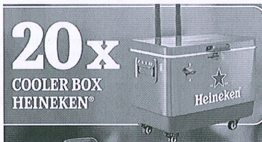
Cooler Box Heineken