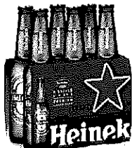
Sticla Heineken® 6X0.33l