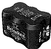
Doza Heineken® 6X0.33l