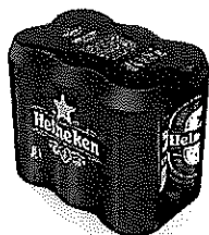
Doza Heineken® 6X0.5l