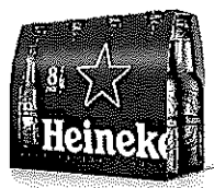
Sticla Heineken® 8x25cl