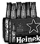
Sticla Heineken® 6X0.33l