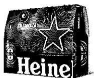
Sticla Heineken® 8X0.25l