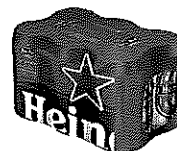
Doza Heineken® 6X0.33l