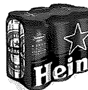
Doza Heineken® 6X0.5l