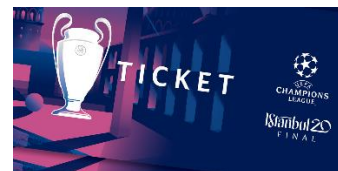
Bilet Finala UEFA Champions League 2020

* Imaginile premiilor sunt cu titlu de prezentare